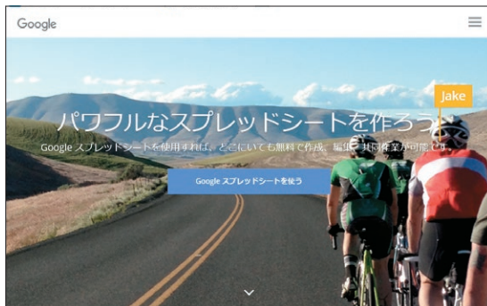
図3 グーグル提供のエクセルみたいな Google スプレッドシートのウェブ・ページ