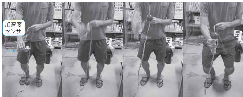
写真1 (a) 精神統一 (b) 振り上げ (c) 剣先より上に (d) 成功 写真1 細い棒で玉をキャッチする「とめけん」を例に経験者と初心者の動きを分類する