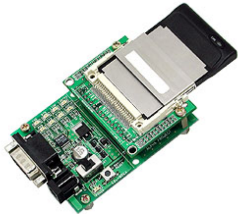
EZL-90 ¥19,800 (税込 ¥20,790) ACアダプタ付属。無線LANカードは付属しません。