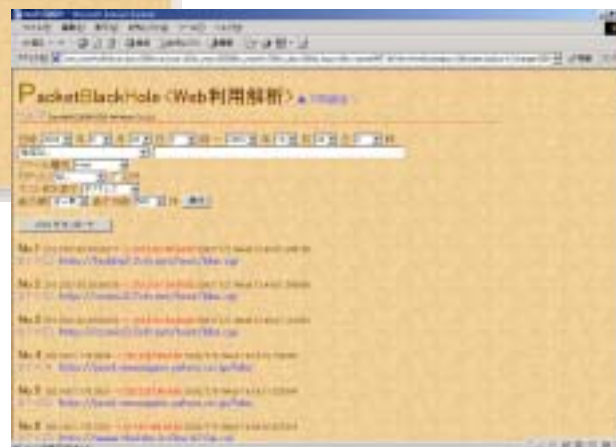
攻撃検知記録画面